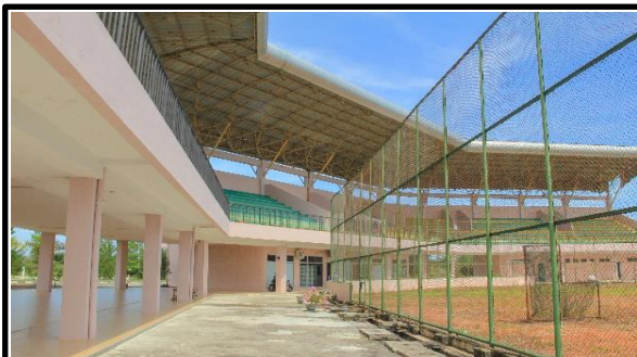
AREA BAWAH TRIBUN