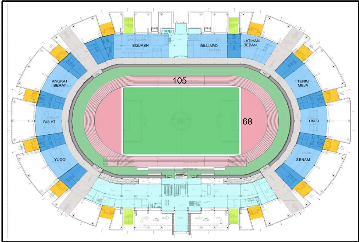
GAMBAR TEKNIS DALAM - LUAR DAN HALAMAN GEDUNG